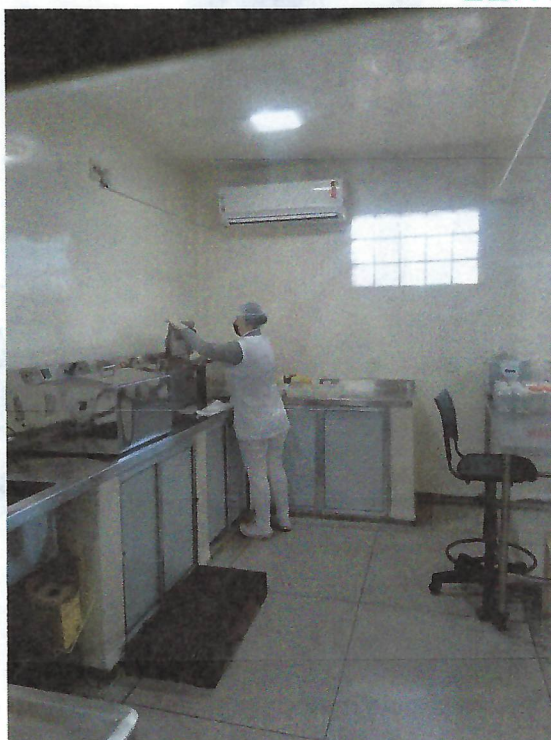
Laboratório – Pasteurização de Leite