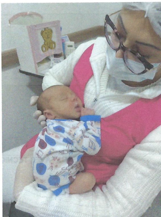
Bebê durante as orientações de técnicas de amamentação