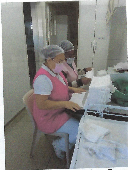
Organização de material utilizado no Banco de Leite